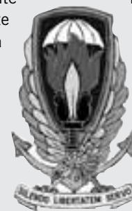
Abzeichen von Gladio