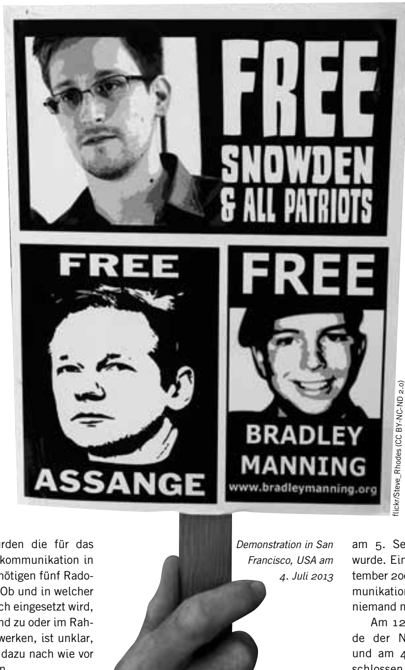
Demonstration in San Francisco, USA am 4. Juli 2013

Am 12. September 2001 dann wurde der Nato-Bündnisfall ausgerufen und am 4. Oktober 2001 formell beschlossen, weil – wir erinnern uns – das