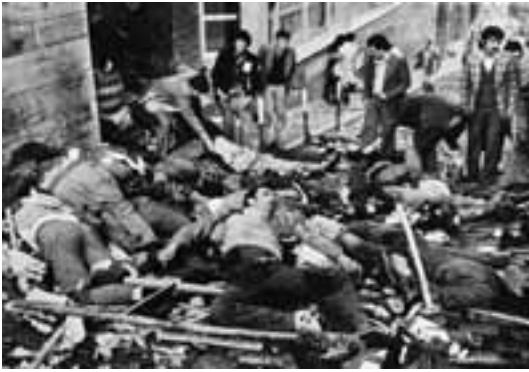
Todesopfer am 1. Mai 1977

der „Nationalistischen Front“. Der Faschist Türke wird stellvertretender Ministerpräsident und kann nun in Ruhe seine Kader im Staatsapparat platzieren. Unliebsame Beamte_innen, Direktoren_innen und Staatsanwälte_innen werden abserviert.