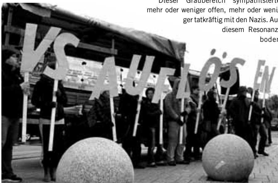
Kundgebung gegen die Eröffnung der Ausstellung des Verfassungsschutzes „Die Braune Falle“ im Polizeipräsidium Köln am 29. Oktober 2012

Geheimdienstlich gesteuert wurde der THS seit 1997 durch die Operation Rennsteig. Hier arbeiteten das BfV, der MAD sowie das thüringische und das bayerische