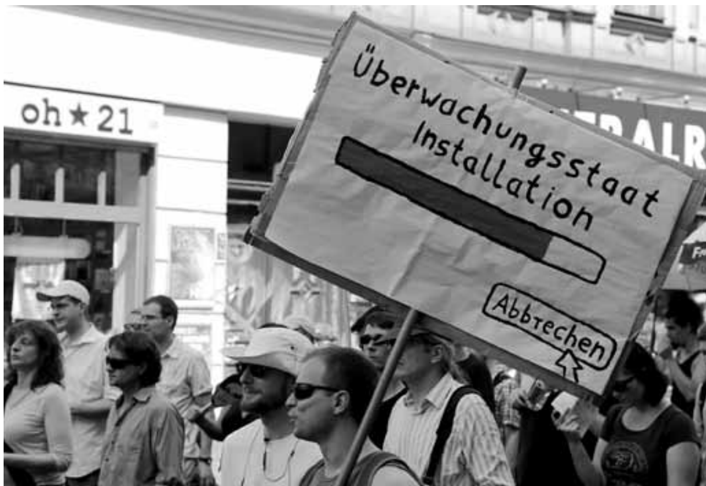
Demonstration „Stop Watching Us“ am 27. Juli 2013 in Berlin