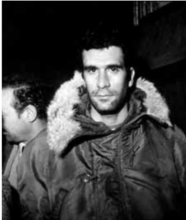
Der türkische Revolutionär Deniz Gezmis (1947–1972)

Bei dem Mordfall Ömer Lütfü Topal wurden auf dem Magazin der Tatwaffe die Fingerabdrücke von Abdullah Çatlı gefunden. Der getötete Ömer Lütfü Topal betrieb in verschiedenen Teilen des Landes Spielcasinos. Nach dem Mord wurden drei Polizeibeamte als Tatverdächtige festgenommen. Unmittelbar nach der Festnahme telefonierte der Parlamentarier Sedat Bucak mit dem Polizeipräsidentium und versuchte die Festgenommenen freizubekommen. Noch am selben Tag wurden die tatverdächtigen Polizisten auf Anweisung des Polizeipräsidenten von Istanbul, Meh-