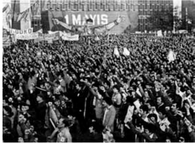
Die 1. Mai-Kundgebung 1976 in Istanbul

In der folgenden Zeit wurde diese Strategie der Spannung stetig gesteigert: Im November 1970 brennt am Taksimplatz