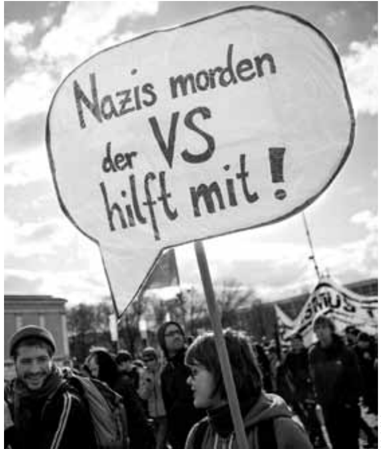
Demonstration zum Auftakt des NSU-Prozesses am 13. April 2013 in München

Ein großer Teil der Thüringer rechten Szene bestand aus Spitzeln des Verfassungsschutzes und es wäre sehr verwunderlich, wenn es hier nicht wenigstens Anwerbeversuche gegeben hätte. Warum hätte man einen hochrangigen organisationsübergreifenden Funktionär, von dessen Kontakten zu dem untergetauchten Trio man weiß, nicht versuchen sollen in seine Dienste zu stellen? Auch Carsten S. berichtet davon, dass ihn drei Autos verfolgt haben und er sich dann hilflos an die Polizei