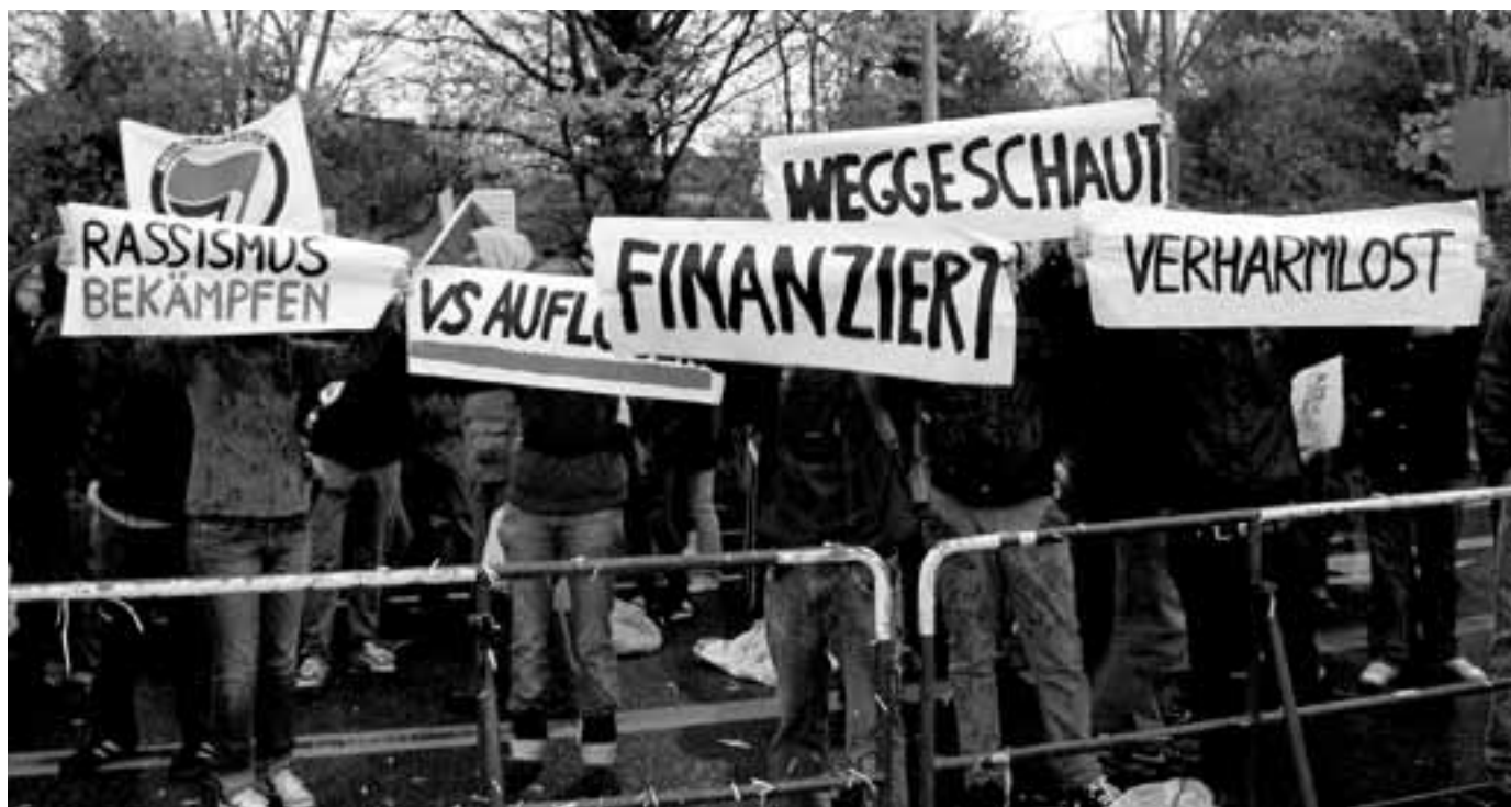
Demonstration „Verfassungsschutz Auflösen – Rassismus Bekämpfen“ am 10. November 2012 Köln