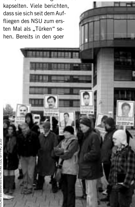
Kundgebung gegen die Eröffnung einer Ausstellung des Verfassungsschutzes in Köln am 29. Oktober 2012

Eine „Strategie der Spannung“ ist besonders effektiv, wenn es ihr gelingt, den Feind, den sie bekämpft, auch zu schaffen (im Extremfall: Islamisten reagieren mit Anschlägen; bei der Sauerlandgruppe ja ebenfalls unter staatlicher Bewachung und mit Hilfestellung). Der Terror samt politisch/polizeilich/medialem Begleitprogramm führte dazu, dass sich MigrantInnen abkapselten. Viele berichten, dass sie sich seit dem Auffliegen des NSU zum ersten Mal als „Türken“ sehen. Bereits in den 80er