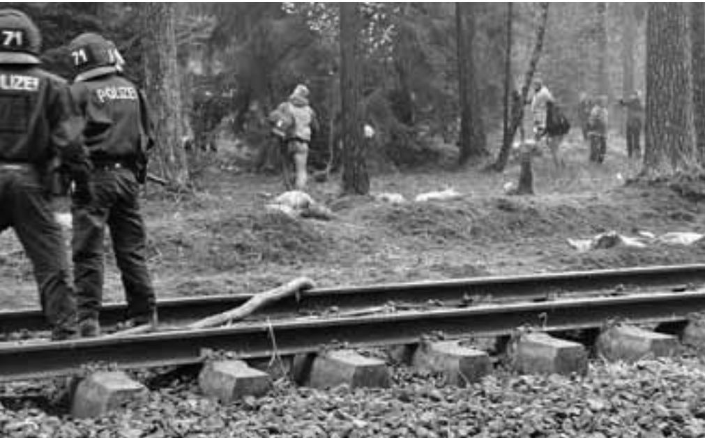
„Castor? Schottern!“ – Freigelegte Bahnschwellen im Wendland, 2010