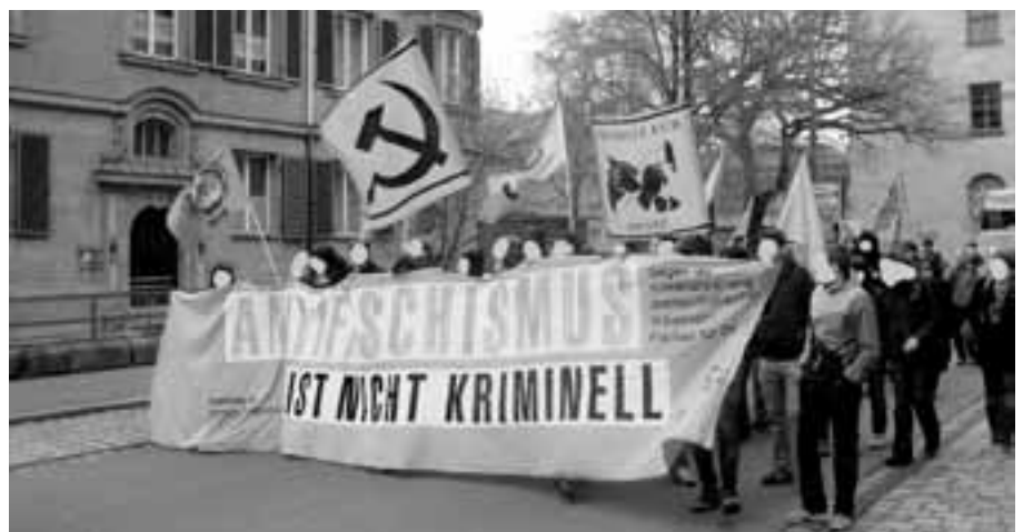
Demonstration am Haftjahrestag am 20.4.2013 vor dem Nürnberger Justizpalast