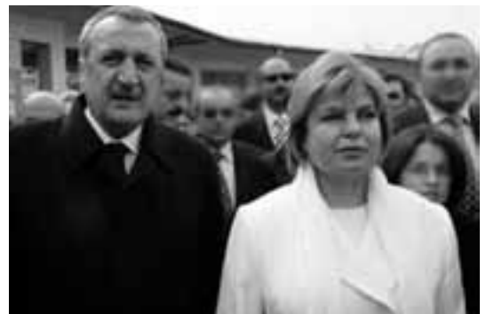
Mehmet Agar (links) war nacheinander Polizeipräsident, Justizminister und Innenminister; Tansu Çiller (rechts) war Ministerpräsidentin und Außenministerin