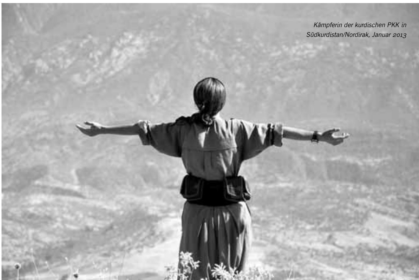
Kämpferin der kurdischen PKK in Südkurdistan/Nordirak, Januar 2013