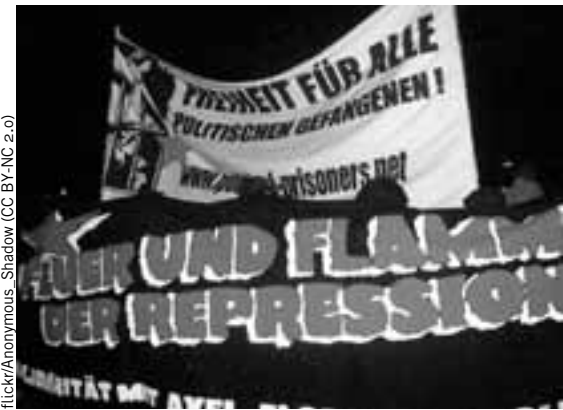
Solidaritätsdemo in Berlin, 2008