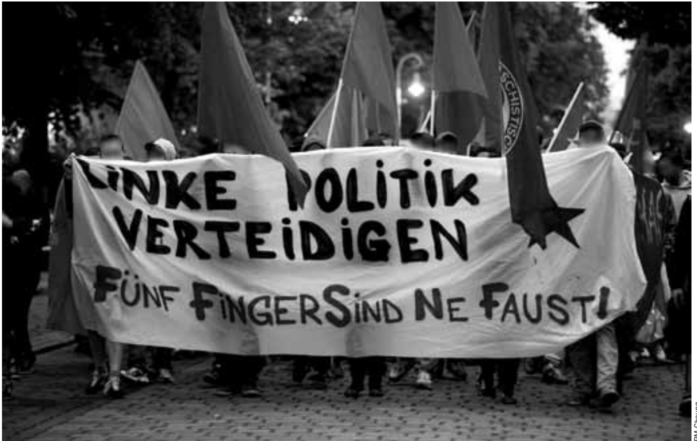
Demonstration am Abend des 24. Mai 2013 in Berlin