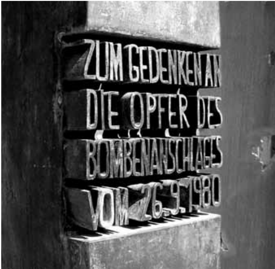
Gedenkstele für die Opfer des Attentats vom 26. September 1980 in München

■ September 1980: Der bayerische Ministerpräsident Franz Josef Strauß, ehemaliger Oberleutnant und „Nationalsozialistischer Führungsoffizier“ der Wehrmacht, steht im Wahlkampf. In wenigen Tagen soll der Bundestag gewählt werden, Strauß möchte Bundeskanzler werden. Am Abend des 26. September kurz nach 22 Uhr detoniert am Haupteingang der Festwiese eine Bombe aus 1,5 Kilogramm TNT. Der Sprengstoff ist in einem mit Nägeln präparierten Feuerlöscher verbaut und in einem Papierkorb versteckt. Durch die Explosion und die umherfliegenden Metallsplinter sterben der mutmaßliche Bombenleger Gundolf Köhler und zwölf FestbesucherInnen, über 200 PassantInnen werden zum Teil schwer verletzt. Unmittelbar nach dem Attentat, noch während die Verletzten zwischen den verstreuten Leichenteilen versorgt werden, erscheint Ministerpräsident Strauß am Tatort und verbreitet am nächsten Tag über die Springer-Presse, dass es sich um einen Anschlag von Linksextremisten handeln würde. Sein Ziel: er will der sozial-liberalen Bundesregierung unter Helmut Schmidt und Hans-Dietrich Genscher eine Mitverantwortung für das Blutbad geben, weil sie angeblich zu wenig für die Innere Sicherheit des Landes tue und die Präventions- und Aufklärungsarbeit der Sicherheitsdienste immer wieder behindere. In einem Kommentar für die Welt am Sonntag schreibt er: „Seit Monaten erhalte ich Andeutungen, dass vor den Wahlen mit einem Anschlag zu rechnen sei“; ein Satz, den man ihm wohl glauben kann.