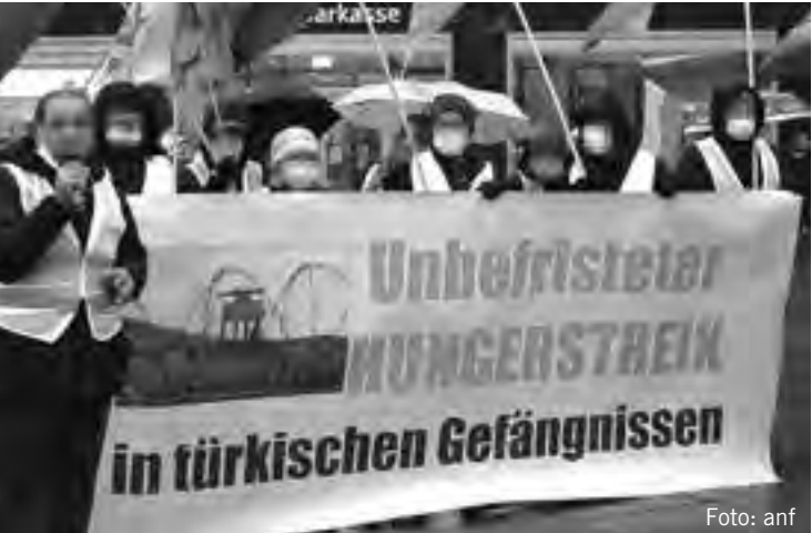
Solidaritätsaktion zur Unterstützung des Hungerstreiks der Gefangenen gegen Isolation und Folter in den Gefängnissen in der Türkei in Berlin am 19.01.2021

Gegen die lebensbedrohlichen, unter der Corona-Pandemie verschärften Haftbedingungen und die ständigen Rechtsverletzungen sowie für ein Ende der Isolation von Abdullah Öcalan befinden sich seit dem 27. November 2020 Tausende Gefangene in den türkischen Gefängnissen jeweils in Gruppen in einem Hungerstreik, auf den der türkische Staat mit verschärfter Repression reagiert. Auch in Deutschland finden zu den Forderungen der Hungerstreikenden viele Solidaritätsaktionen statt, an denen wir uns beteiligen sollten.