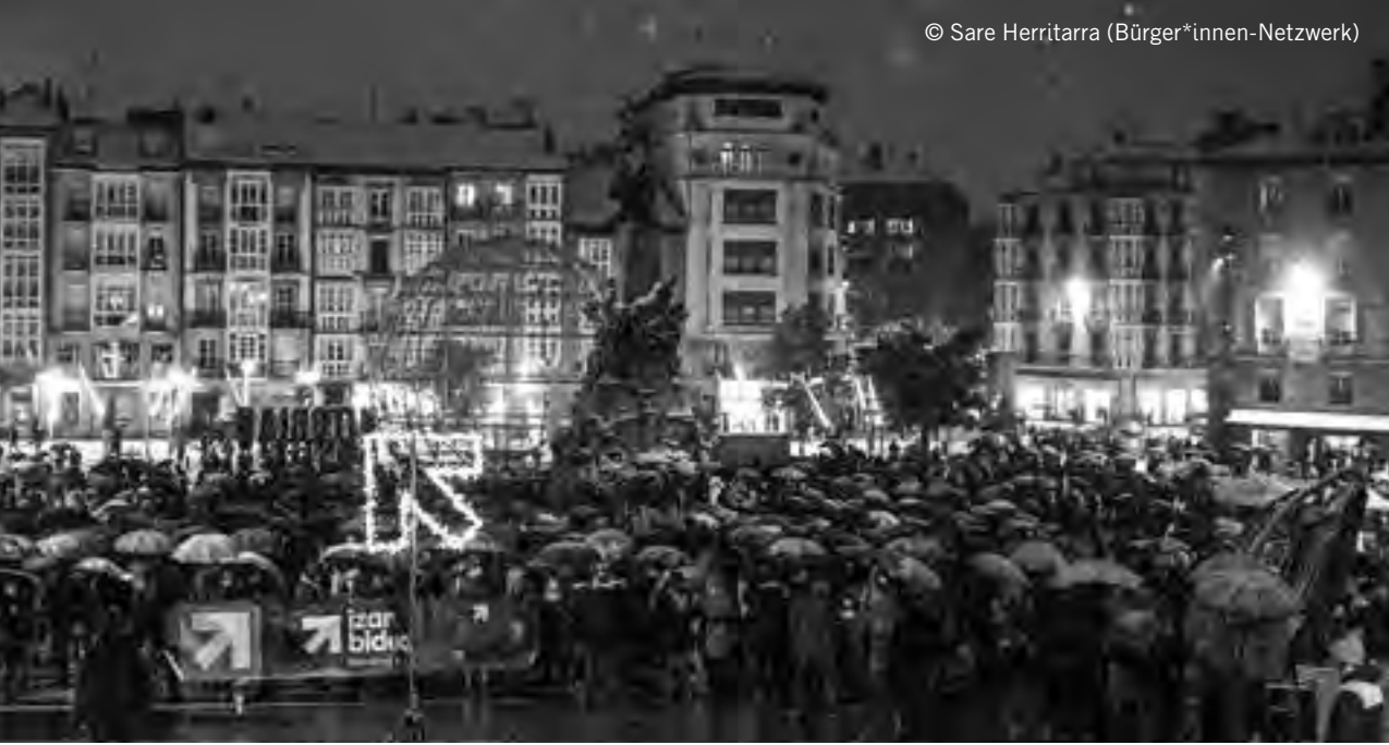
Protest in Gasteiz am 09.01.2021, IZAN BIDEAN – Wir sind auf dem Weg, İbilitarien sarea – gemeinsam

Andere Familienangehörige und Freund*innen glauben nicht, dass die Impfung in die Knäste kommt, jedenfalls nicht vor September 2021. Darüber nachdenken, ob wir für oder gegen die Impfung sind, können wir uns nicht einmal leisten. Wir wissen, dass Familien- und Intimbefuche nur dann gestattet werden, wenn wir geimpft sind. Es ist jetzt Anfang Januar, und ich habe ihn seit neuneinhalb Monaten nicht mehr in den Armen gehalten.