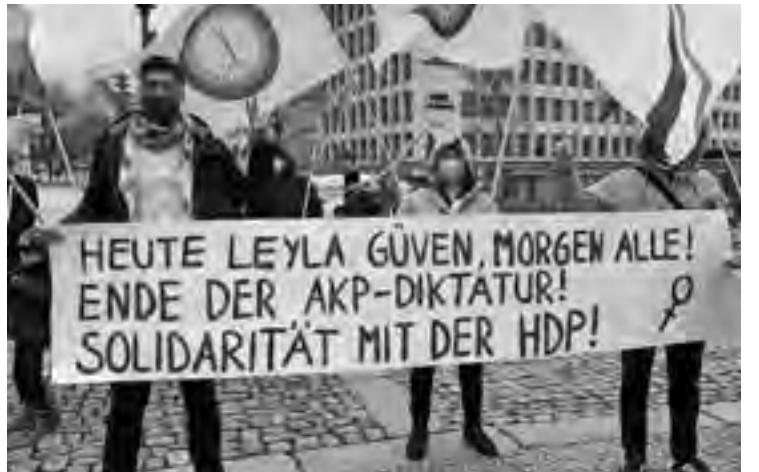
Bielefeld, 27.12.2020

Wegen der Proteste wurde ab Ende September 2019 eine Festnahmewelle losgetreten, die insbesondere im Jahr 2020 einen spürbaren Höhepunkt erreichte. In deren Folge ergingen zunächst offiziell für 82 Personen Haftbefehle. Später erhöhte sich dann jedoch die Zahl auf 108. Insgesamt wurden letztes Jahr im Rahmen dieses Verfahrens jedoch Hunderte Menschen festgenommen, um von ihnen Geständnisse zu erzwingen oder Falschaussagen zu erpressen. Im Januar 2021 endete das Hauptverfahren dann mit dem Ergebnis, dass sieben Personen zu lebenslänglichen Haftstrafen und die anderen Angeklagten ebenfalls zu mehrjährigen Haftstrafen verurteilt wurden. Im Zuge dessen wurde auch einer unbekannten Zahl an Politiker*innen der HDP die Immunität aberkannt; einige wurden zu Hausarrest oder Ausreiseverbot verurteilt.