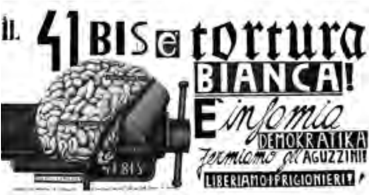
Der 41bis ist weiße Folter! Er ist eine demokratische Schande Stoppen wir die Folterer! Befreien wir die Gefangenen!

Das Haftregime gegen Linke hat in Italien eine lange Tradition: Je nachdem, welcher Maßnahme die Gefangenen unterliegen, werden sie in einem bestimmten Abschnitt des Gefängnisses festgehalten. Der schlechteste Ort auf der Skala der im Gefängnisssystem herrschenden Bedingungen ist die Einstufung in „41bis“. Der Artikel 41bis wurde vor 30 Jahren angeblich als vorübergehende und dringende Maßnahme eingeführt, existiert jedoch heute noch und wurde zusätzlich verschärft. Mit ihm wurde ein Haftregime geschaffen, das aus 23 Stunden Einzelhaft pro Tag, nur einem Besuch für eine Stunde pro Monat von engen Angehörigen durch Glas „gesichert“, der Verhinderung der physischen Anwesenheit der Angeklagten in den Prozessen durch den Einsatz von Videokonferenzen, Post- und Buchzensur usw. besteht. Um diesen Bedingungen zu entkommen, müsste die gefangene Person mit den Justizbehörden zusammenarbeiten. Selbst das Europäische Komitee zur Verhütung von Folter und unmenschlicher oder erniedrigender Behandlung oder Strafe beurteilte schon 1995 dieses Gefängnisregime als unmenschlich und erniedrigend.