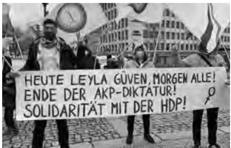
Bielefeld, 27.12.2020

Wegen der Proteste wurde ab Ende September 2019 eine Festnahmewelle losgetreten, die insbesondere im Jahr 2020 einen spürbaren Höhepunkt erreichte. In deren Folge ergingen zunächst offiziell für 82 Personen Haftbefehle. Später erhöhte sich dann jedoch die Zahl auf 108. Insgesamt wurden letztes Jahr im Rahmen dieses Verfahrens jedoch Hunderte Menschen festgenommen, um von ihnen Geständnisse zu erzwingen oder Falschaussagen zu erpressen. Im Januar 2021 endete das Hauptverfahren dann mit dem Ergebnis, dass sieben Personen zu lebenslänglichen Haftstrafen und die anderen Angeklagten ebenfalls zu mehrjährigen Haftstrafen verurteilt wurden. Im Zuge dessen wurde auch einer unbekanntem Zahl an Politiker*innen der HDP die Immunität aberkannt; einige wurden zu Hausarrest oder Ausreiseverbot verurteilt.