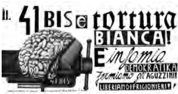
Der 41bis ist weiße Folter! Er ist eine demokratische Schande. Stoppen wir die Folterer! Befreien wir die Gefangenen!

Das Haftregime gegen Linke hat in Italien eine lange Tradition: Je nachdem, welcher Maßnahme die Gefangenen unterliegen, werden sie in einem bestimmten Abschnitt des Gefängnisses festgehalten. Der schlechteste Ort auf der Skala der im Gefängnisystem herrschenden Bedingungen ist die Einstufung in „41bis“. Der Artikel 41bis wurde vor 30 Jahren angeblich als vorübergehende und dringende Maßnahme eingeführt, existiert jedoch heute noch und wurde zusätzlich verschärft. Mit ihm wurde ein Haftregime geschaffen, das aus 23 Stunden Einzelhaft pro Tag, nur einem Besuch für eine Stunde pro Monat von engen Angehörigen durch Glas „gesichert“, der Verhinderung der physischen Anwesenheit der Angeklagten in den Prozessen durch den Einsatz von Videokonferenzen, Post- und Buchzensur usw. besteht. Um diesen Bedingungen zu entkommen, müsste die gefangene Person mit den Justizbehörden zusammenarbeiten. Selbst das Europäische Komitee zur Verhütung von Folter und unmenschlicher oder erniedrigender Behandlung oder Strafe beurteilte schon 1995 dieses Gefängnisregime als unmenschlich und erniedrigend.