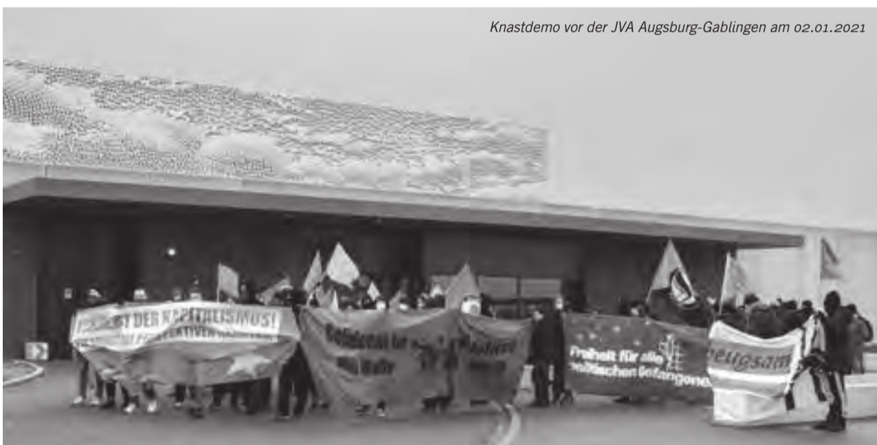
Knastdemo vor der JVA Augsburg-Gablingen am 02.01.2021